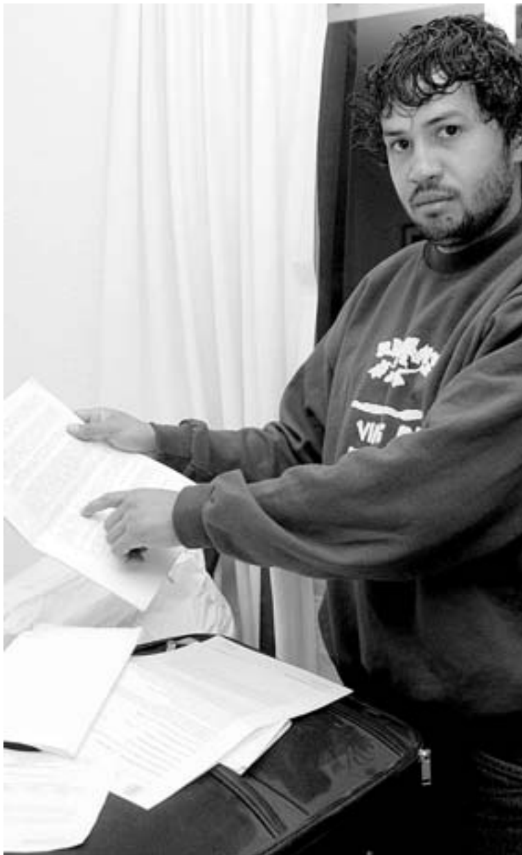
DE MADRID A LOGROÑO. Lorenzo llegará hoy.

El 23 de enero del 2009 Lorenzo será juzgado por permanencia ilegal en España desde 2006