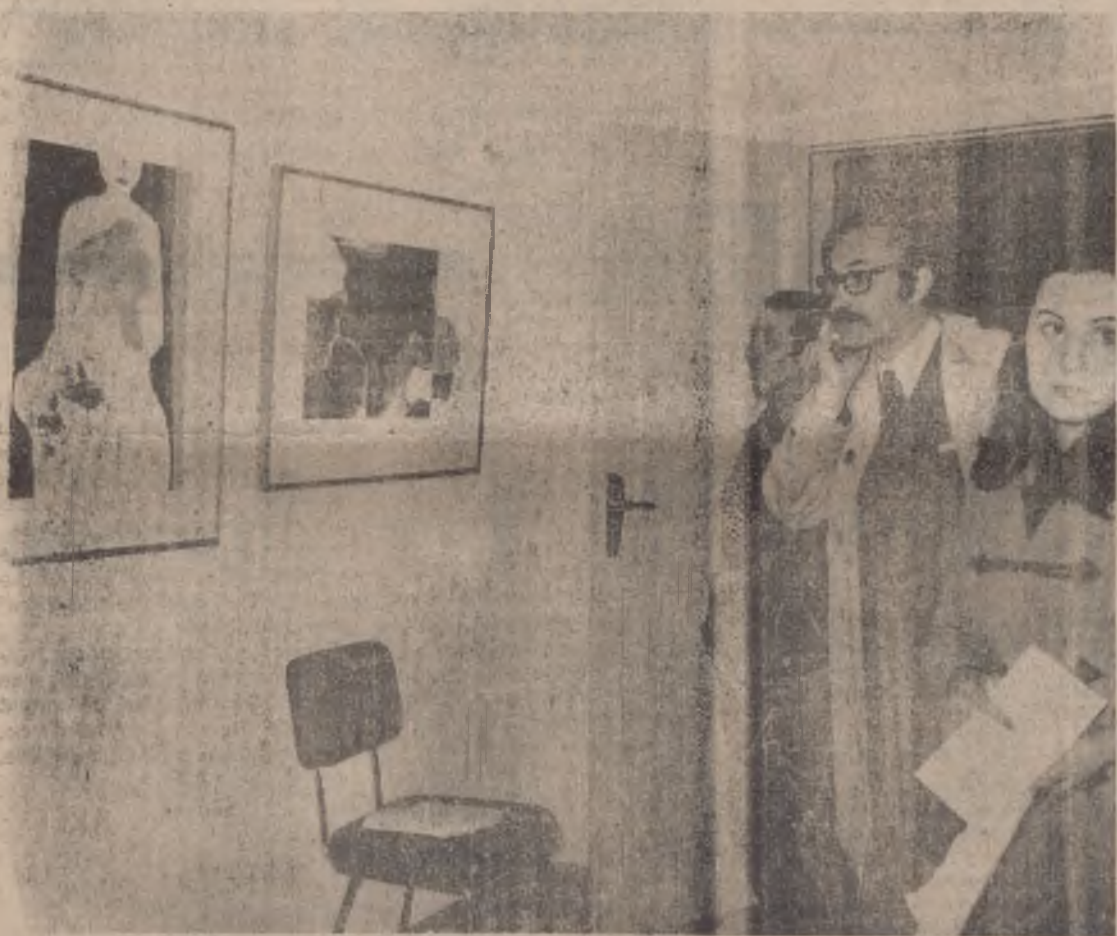
Xilografías en el Museo

El Consejo, como colofón, tomó el acuerdo de desplazarse semanalmente a una de las cabeceras de comarca de nuestra provincia.