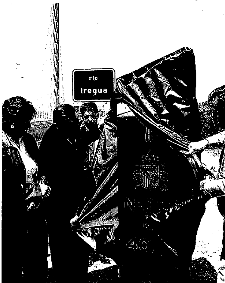
Sanz y Cascos destapan el pivote que anuncia la nueva vía.

El acto de inauguración consistió en el protocolario corte de la cinta, en el que participó el ministro de Fomento, flanqueado por el presidente del Gobierno riojano, por el alcalde de Logroño, Julio Revuelta, por la vicepresidenta regional, Aránzazu Vallejo, por