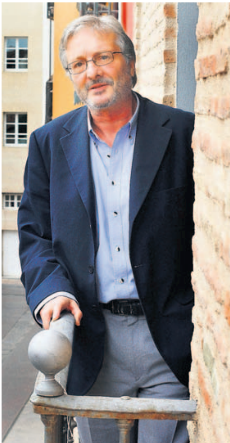
Bartolomé, ayer durante su estancia en Logroño.

– El presupuesto público tiene un efecto compensatorio. En las fases en las que el PIB crece rápidamente, los ingresos aumentan. Y al revés: cuando las cosas van muy mal, el sector público tiene que contrarrestar la bajada de la demanda privada. Ello supone déficit, lo cual no es necesariamente negativo porque el problema no es el déficit sino el grado de la deuda pública, y España sigue con unos niveles inferiores en términos relativos a la media europea. Partiendo de ahí, nuestra propuesta es aprovechar el presupuesto para movilizar el sistema productivo que está paralizado. La responsabilidad de los poderes públicos es activarlo y crear riqueza.