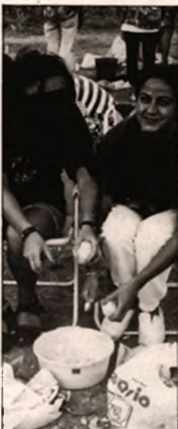
Trabajando con comodidad

SANTO DOMINGO. — Además de los cinco kilos de patatas que se entregaron a cada una de las ochenta y tres cuadrillas concursantes, otros seiscientos kilos se emplearon para elaborar nueve «calderales gigantes», condimentados además con cien kilos de chorizo, que fueron consumidos en su totalidad por el público asistente.