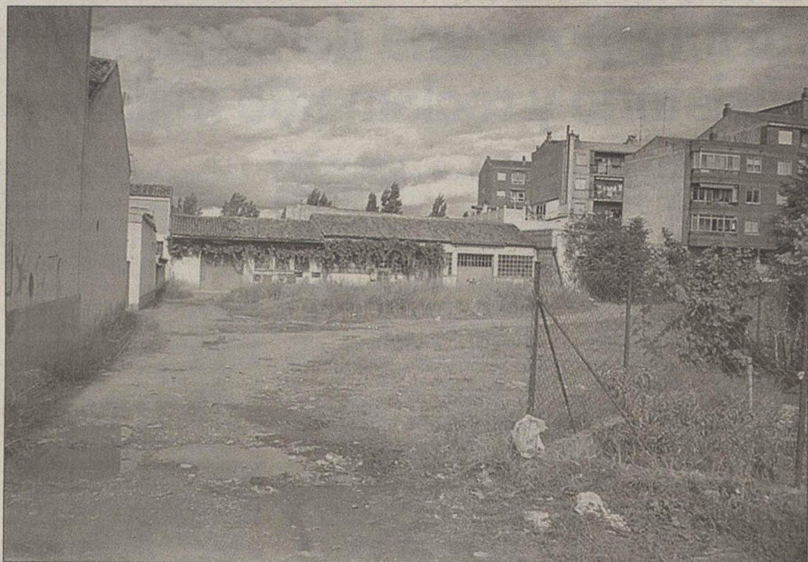
Terrenos ubicados detrás del cuartel, afectados por una de las modificaciones.

“Acab-Rioja”, creada en la localidad de Nájera, cumplirá dos años en octubre y en la actualidad engloba a 29 familias de afectados por la anorexia y la bulimia.