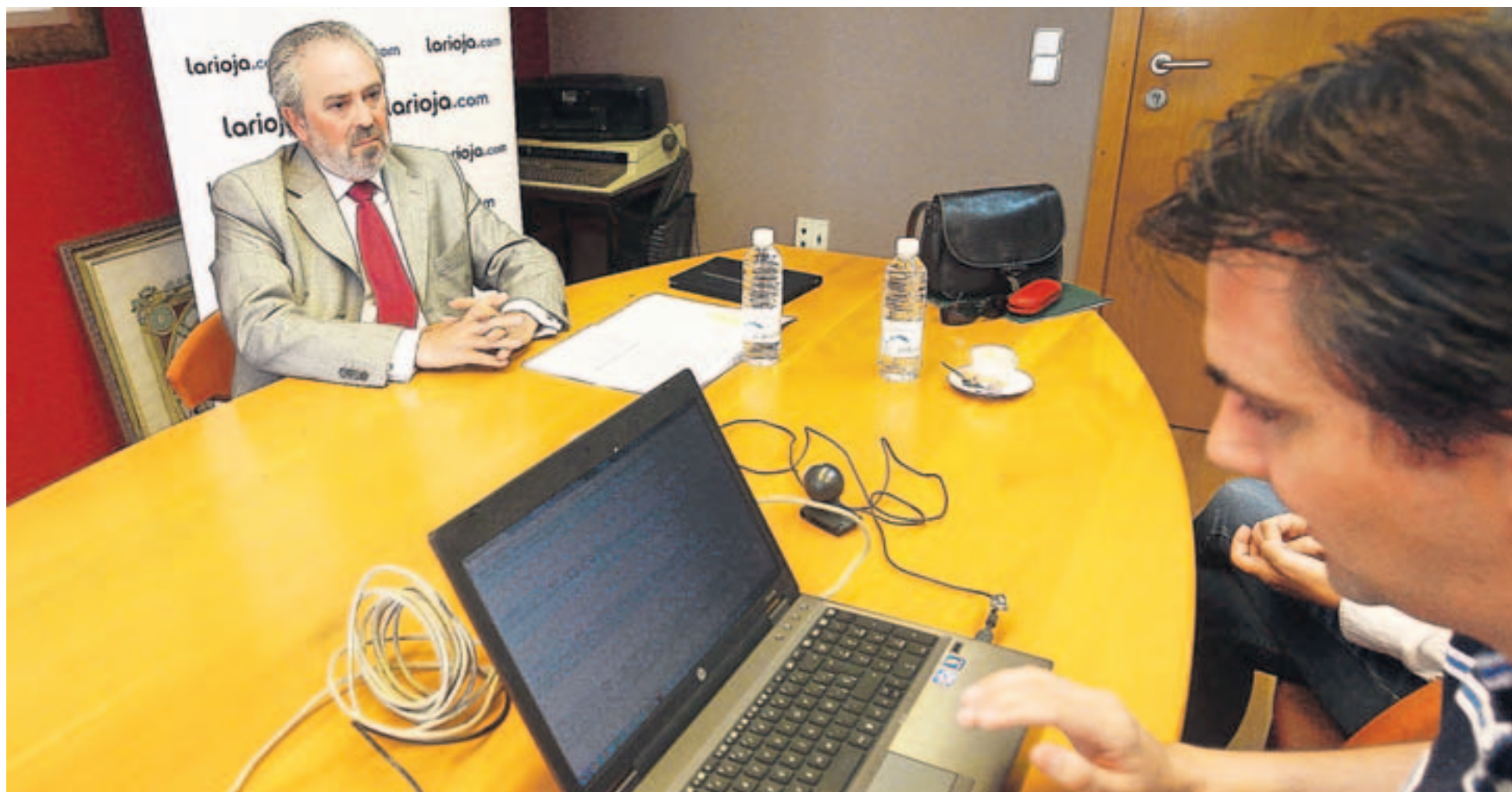
El consejero de Salud, en las instalaciones de Diario LA RIOJA durante su participación en el videochat organizado por larioja.com.