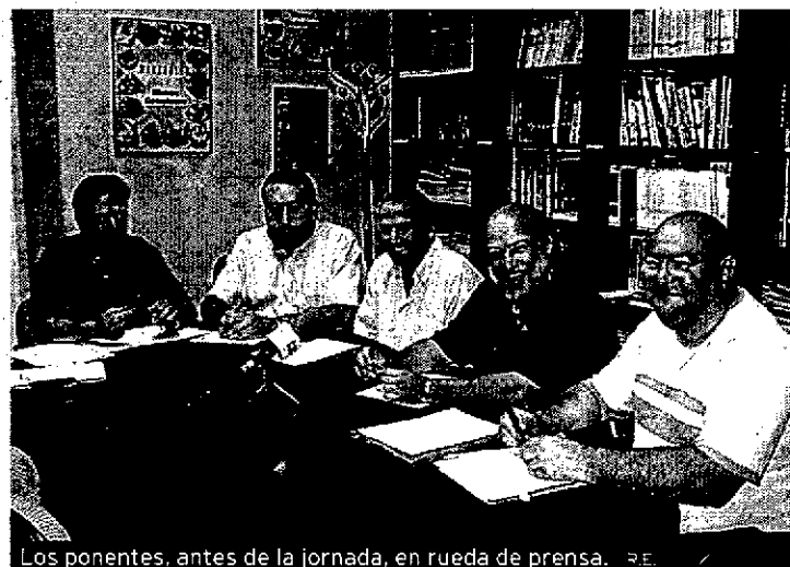
Los ponentes, antes de la jornada, en rueda de prensa.

Sobre la junta general ordinaria de 'Inar' dijo que «se convoca porque obliga la ley pero sin espíritu de participación», que «es una puesta en escena del alcalde, que es el actor principal» y que, por todas las razones expuestas, el PP votaría en contra.