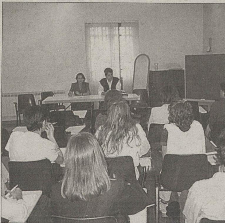
Asistentes al curso sobre gestión ambiental.

Para ello, el curso va a aportar una formación complementaria "desde el punto de vista institucional, jurídico, técnico y científico. Vamos a intentar superar las carencias que se pueden percibir en alguno de estos aspectos, que se evidencian después de salir de la Universidad, a raíz de una falta de conexión con el mundo laboral,