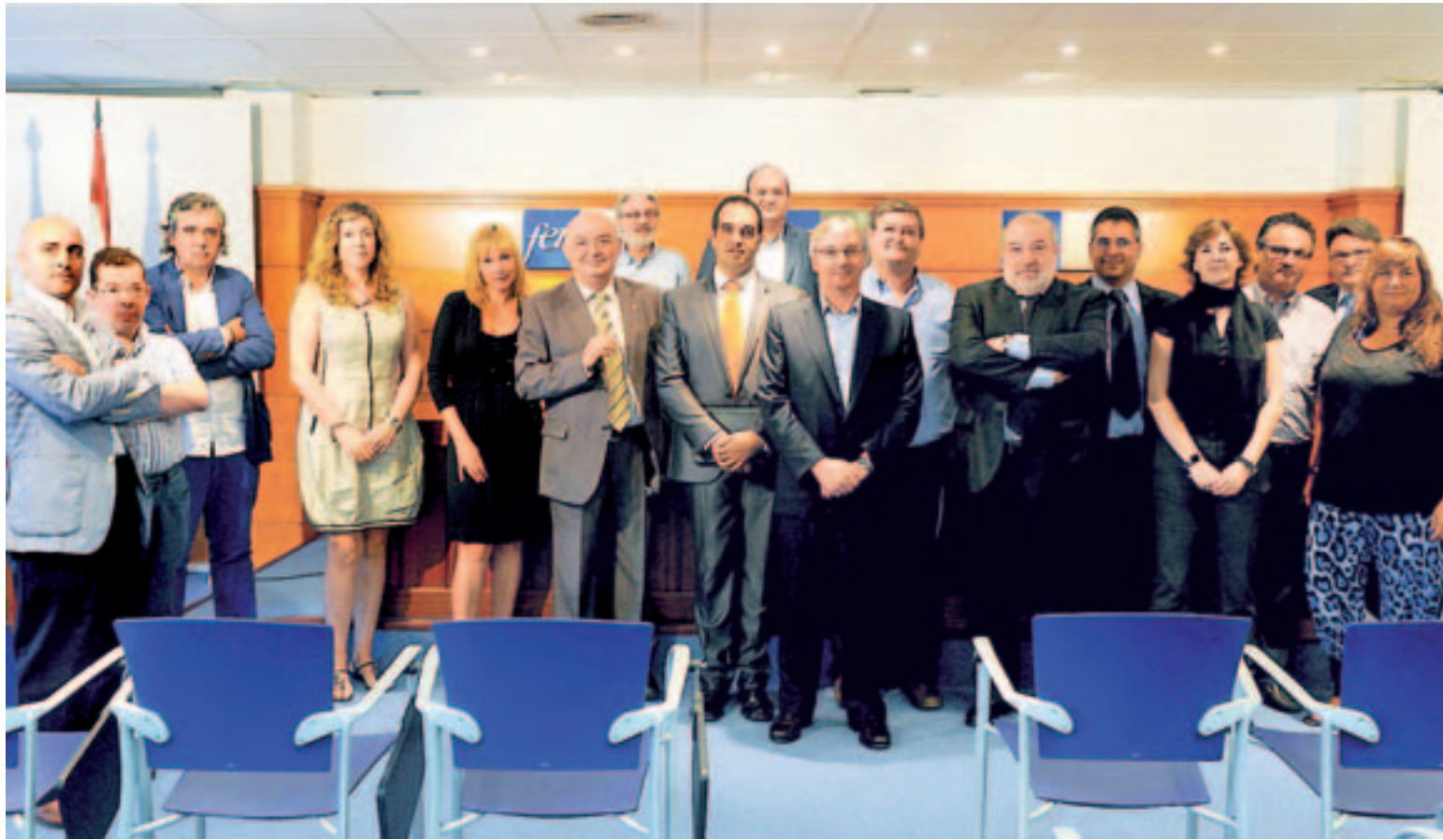
El presidente de la FER, Julián Doménech, junto a los presidentes de las asociaciones en la presentación de la Plataforma.