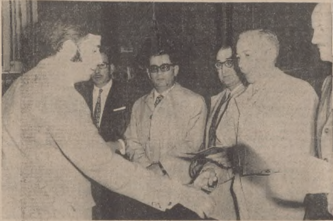
HARO.