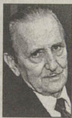
Antonio Buero Vallejo.