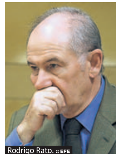
Rodrigo Rato.

Los españoles se muestran especialmente orgullosos de la sensación que proyectan a otros países su sociedad y su cultura, a las que otorgan un 5,4 y un 5,2, respectivamente. En este sentido cabe destacar que hasta un 65% de los entrevistados se muestra a favor de incrementar o mantener el gasto público en cultura. La peor calificación la recibe la economía, que debe conformarse con un escaso 3,0. La política se sitúa como otro de los puntos flojos del país al recibir un 3,2 de nota.