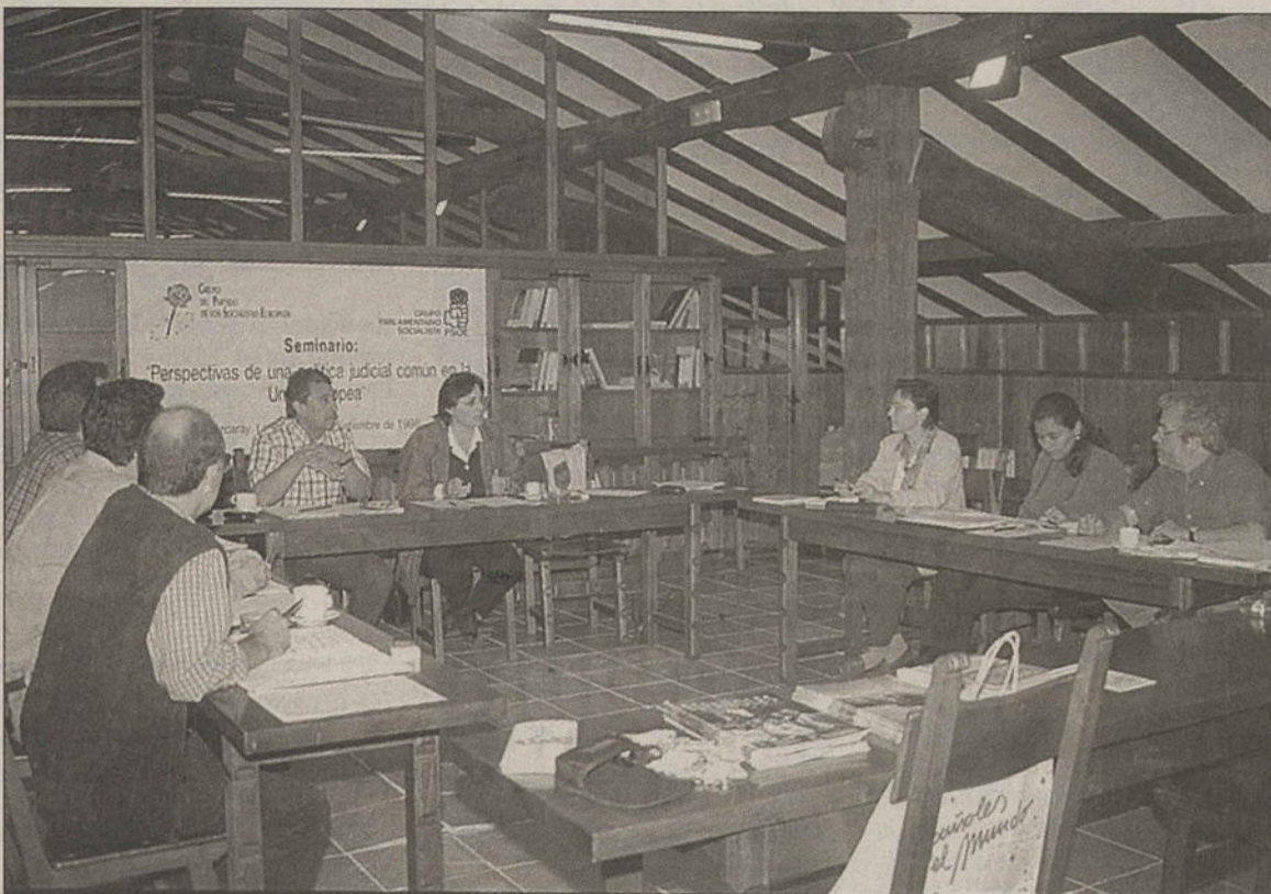
Representantes socialistas y del mundo del Derecho, ayer en Ezcaray.

CCOO muestra su preocupación porque "no existe una prestación que proteja mínimamente a las personas desempleadas con cargas familiares y sin rentas alternativas o muy limitadas (el límite actual de renta para acceder al subsidio es del 75 por ciento del Salario Mínimo Interprofesional)".