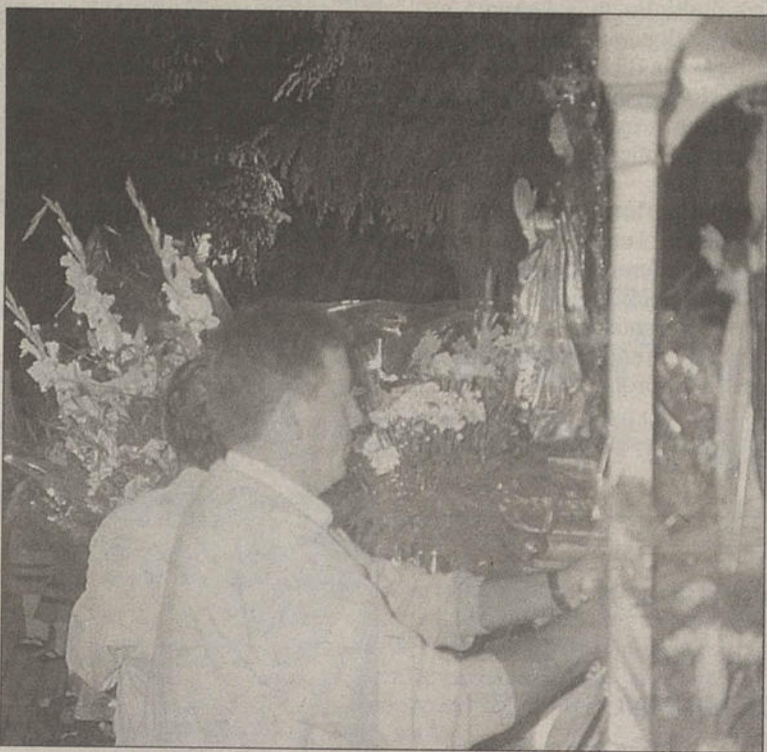
Ofrenda de flores a la Virgen del Campo, celebrada recientemente.

Por otra parte, hoy continúan también las fiestas en Foncea, con misa solemne, a las 13 horas, en la que intervendrá el grupo de jotas