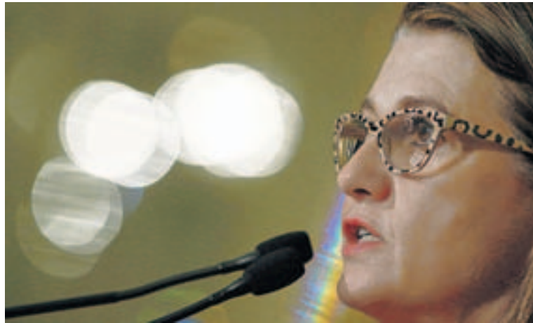
La presidenta del Círculo de Empresarios, Mónica de Oriol, ayer, en Madrid.

El gasto en desempleo, con más de 30.000 millones de euros al año, es uno de los grandes capítulos de los Presupuestos y, por tanto, objeto de atención a la hora de buscar partidas para recortar. El gasto en este capítulo ha vuelto a repuntar en los últimos tiempos como consecuencia de la fuerte ro-