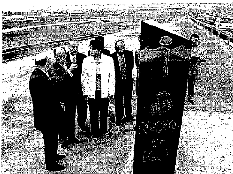
Autoridades, durante la inauguración de la obra.

El secretario de Estado de Infraestructuras, Benigno Blanco, evitó pronunciarse en Navarrete sobre el estado del proyecto del túnel de Piqueras, pero dijo que hay que estar «muy atentos al BOE» (Boletín Oficial del Estado). «El Ministerio anuncia las fechas de sus obras y proyectos en el BOE, y hay que estar muy atentos», se limitó a indicar Benigno Blanco antes de recorrer el trazado de la nueva autovía-variante.