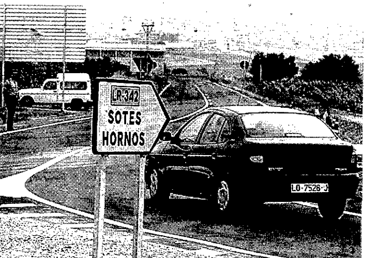
Cruce de Navarrete, que soporta 12.000 vehículos diarios.