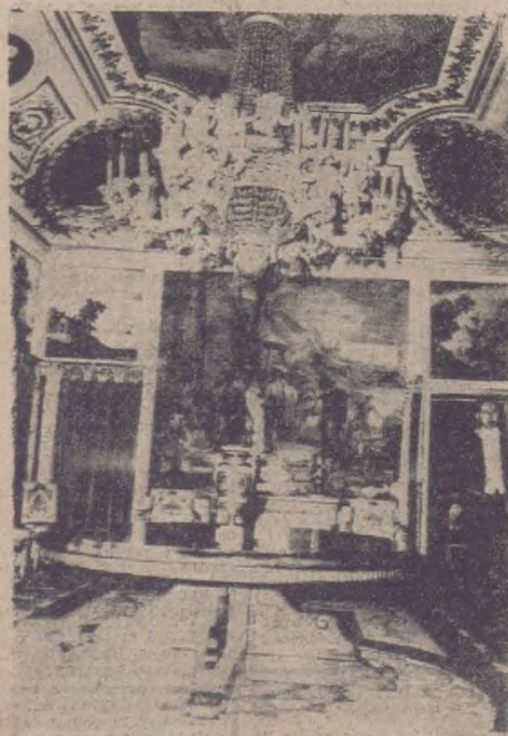
El Pardo, lugar donde se celebrará la ceremonia.

Hoy, con motivo de esta boda, se han instalado tiendas de montaje provisional en sus patios, que son un bello marco para tal acontecimiento.