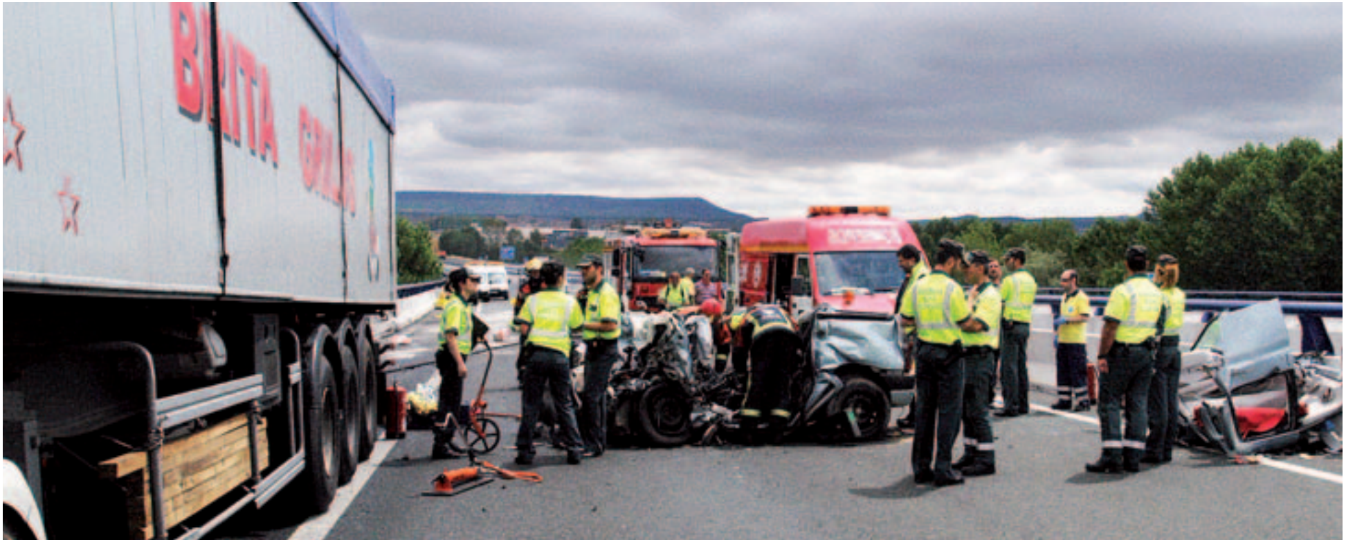
Efectivos de la Guardia Civil, de bomberos y de los servicios de emergencias, ayer junto al vehículo siniestrado en la autovía A-12, a su paso por Nájera.