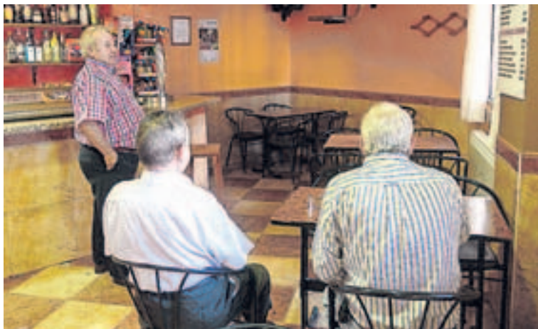
El accidente era comentario generalizado ayer en Hormilla. :: DÍAZ URIEL

Una vecina del pueblo explicó que «esta mañana (por ayer) ha venido a comprar el pan el marido y dijo que iban al médico a Logroño». Los numerosos vecinos que se encontraban en el Hogar de la Tercera Edad de Hormilla no hablaban de otro asunto: «era una familia muy cono-