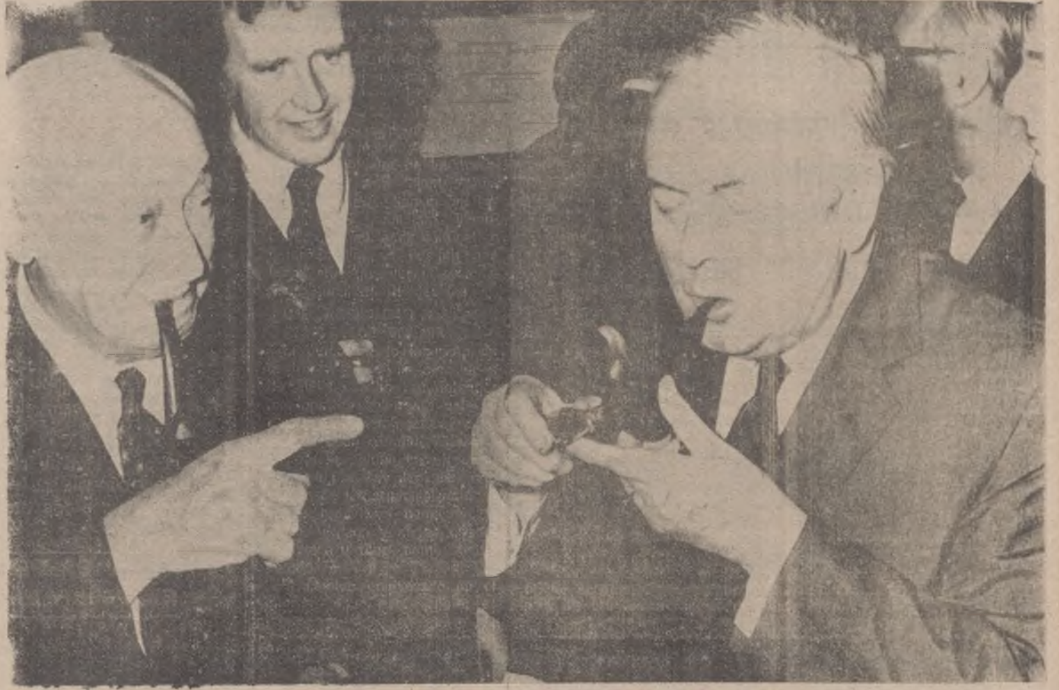
Wilson, a pesar de los problemas internos de su partido, no ha perdido el buen humor ni esa costumbre tan inglesa de fumar en pipa. Mientras, el veterano miembro del Parlamento lord Shinwell ha encendido la suya, ganándole a Harold a la hora de encender la cachimba.

El pasado día 10 presentaron su dimisión en el "Gabinete fantasma" el actual número 2 del partido laborista, Roy Jenkins, y los ministros de Defensa y Energía, George Thompson y Harold Laver. Veinticuatro horas más tarde le tocaba el turno dimisionario a lord Chalfont, portavoz laborista de política exterior, y se anuncia que las sorpresas van a seguir produciéndose, dirigidas contra la política de Wilson, a quien los disidentes acusan de dar bandazos continuos.